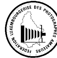
PHOTO-CLUB PÉTANGE Grand-Duché de Luxembourg